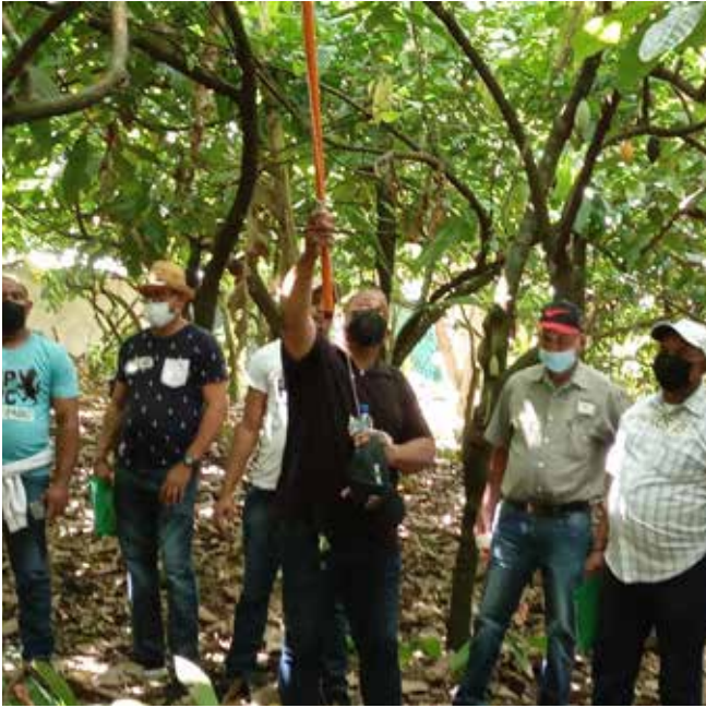
Técnicos realizan una labor de poda en cacao en el taller sobre Metodología de Escuela de Campo impartido por el CEDAF en la Dirección Regional Nordeste, de San Francisco de Macorís, los días 9, 10 y 11 de noviembre de 2021, donde participaron unos 24 personas.