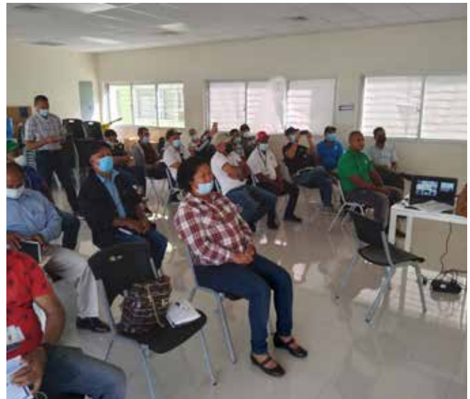
Parte de los técnicos que asistieron al taller sobre Metodología de Grupo de Ahorro Agropecuario (GAA), impartido en La Vega, Dirección Regional Norcentral, del Ministerio de Agricultura, los días 27 y 28 de octubre del 2021, donde participaron 21 extensionistas.