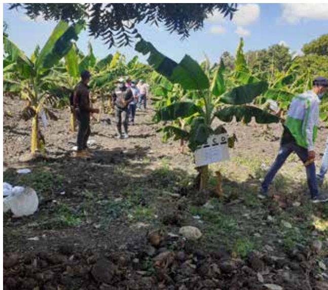
Técnicos participantes durante la Prueba de Caja del taller sobre Metodología de Escuelas de Campo impartido en la Dirección Regional Norte, en Santiago, del Ministerio de Agricultura, los días 3, 4 y 5 de octubre del 2021, en el que fueron capacitados 24 técnicos extensionistas.