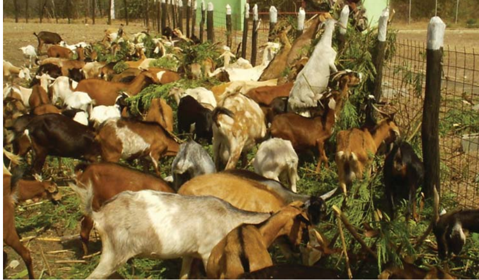
Cabras consumiendo leucaena