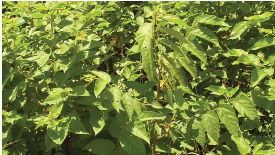
Parcela de guásuma antes del corte