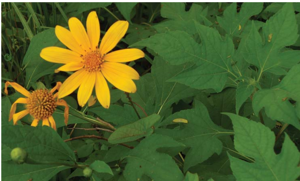
Parcelas de titonia antes del corte