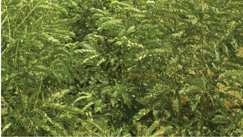
Parcela de Chachá antes del corte