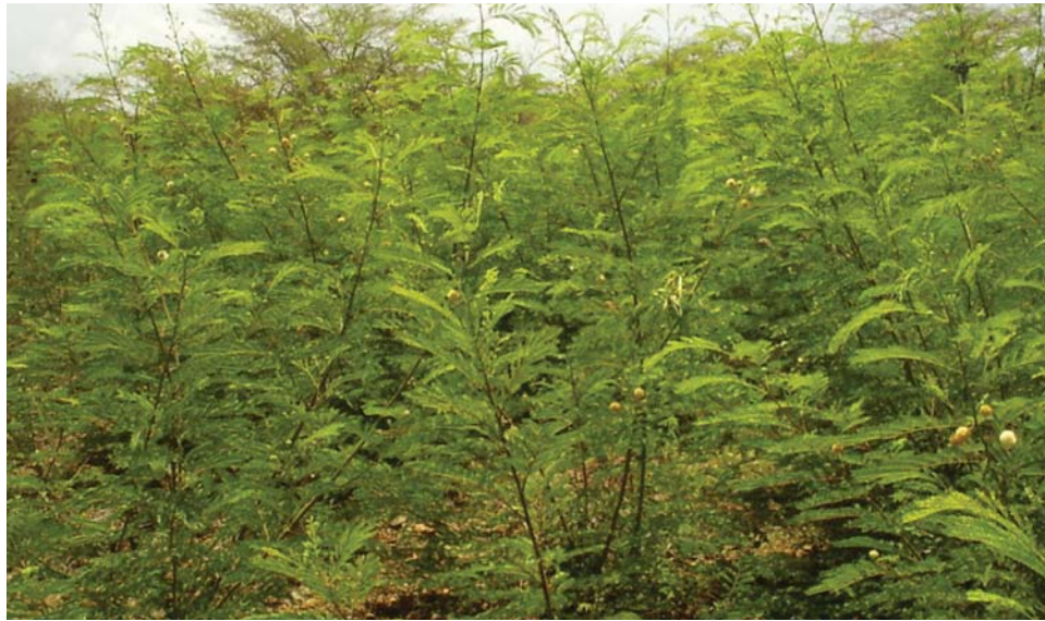
Parcela antes del corte