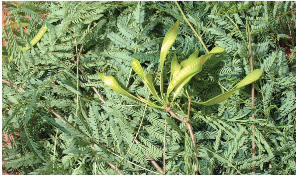
forraje de leucaena