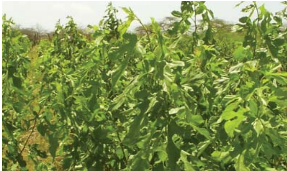
Plantación de morera antes del corte.