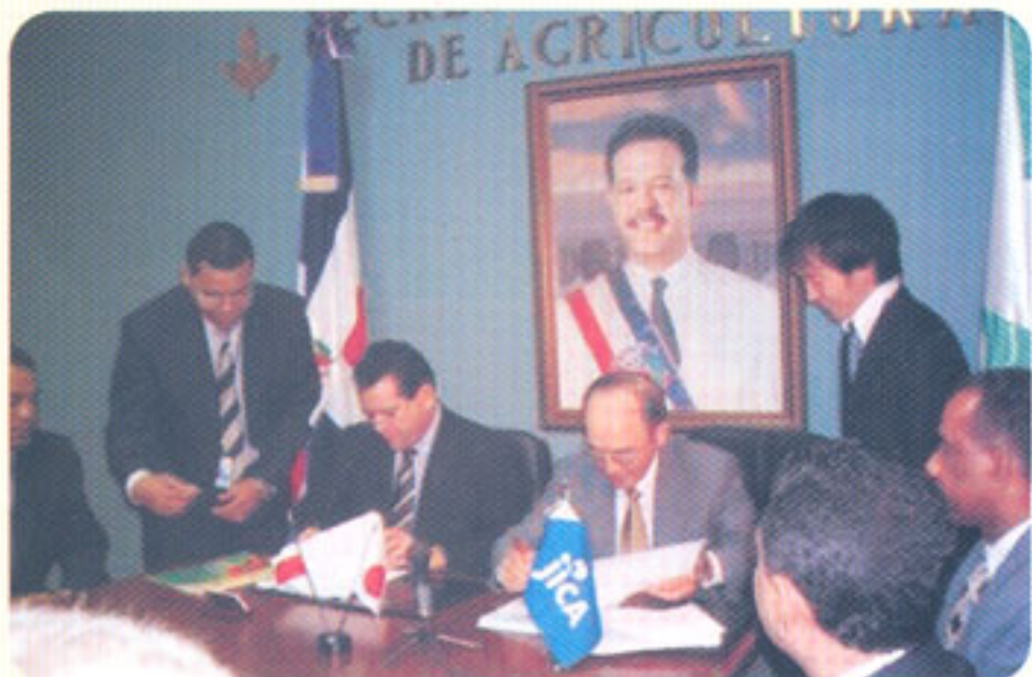
Firma del Convenio entre JICA, IDIAF y SEA

Siguiendo los lineamientos de la Agencia de Cooperación Internacional del Japón (JICA) en su programa de cooperación "Combate a la Pobreza y Desarrollo Económico", se ha tenido la iniciativa de llevar a cabo un proyecto que ayude a los pequeños agricultores a elevar su nivel de ingreso. Al mismo tiempo se persigue aplicar técnicas que contribuyan a la preservación del medio ambiente.