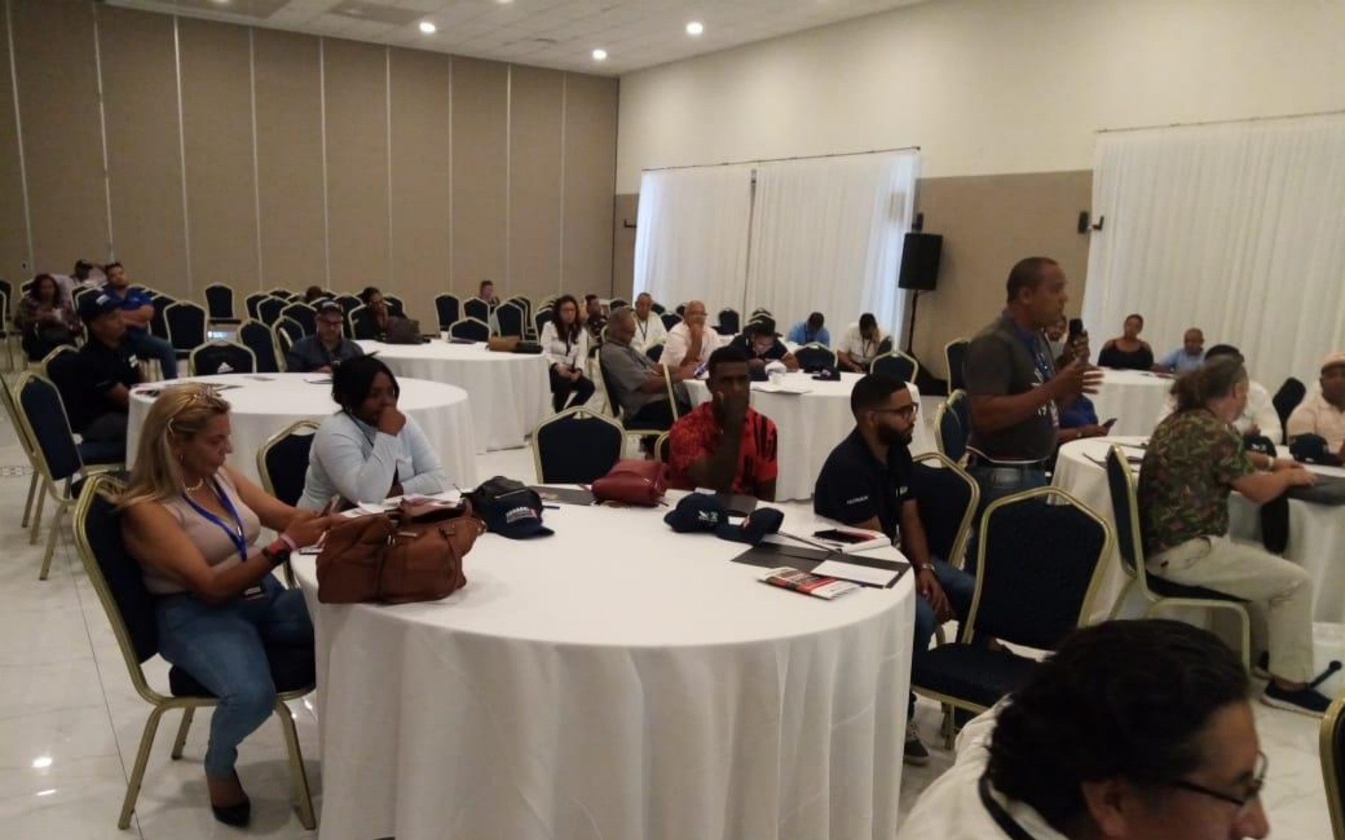
Foro Acuicultura Regional: Presente y Futuro Publico Presente