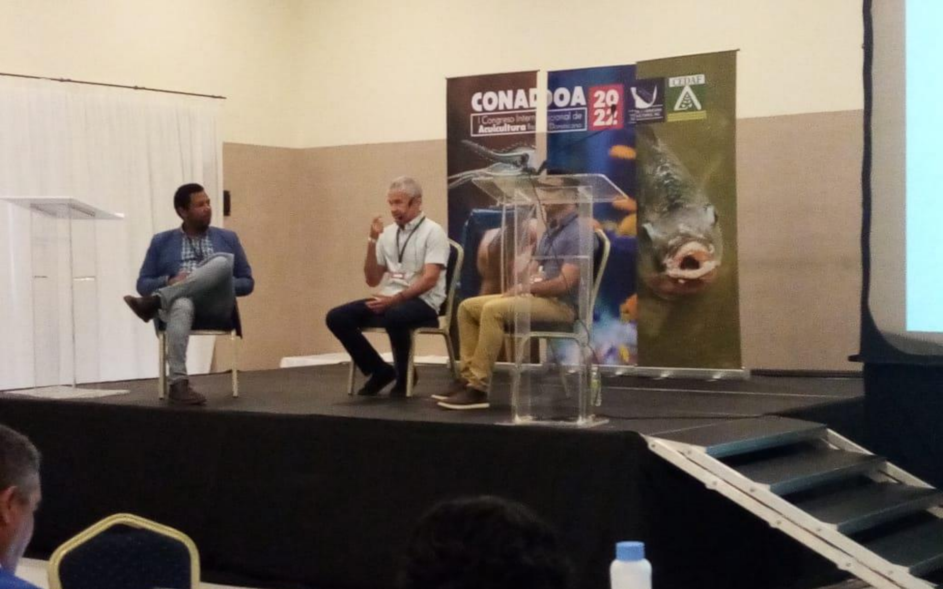
Foro Acuicultura Regional: Presente y Futuro Publico Presente