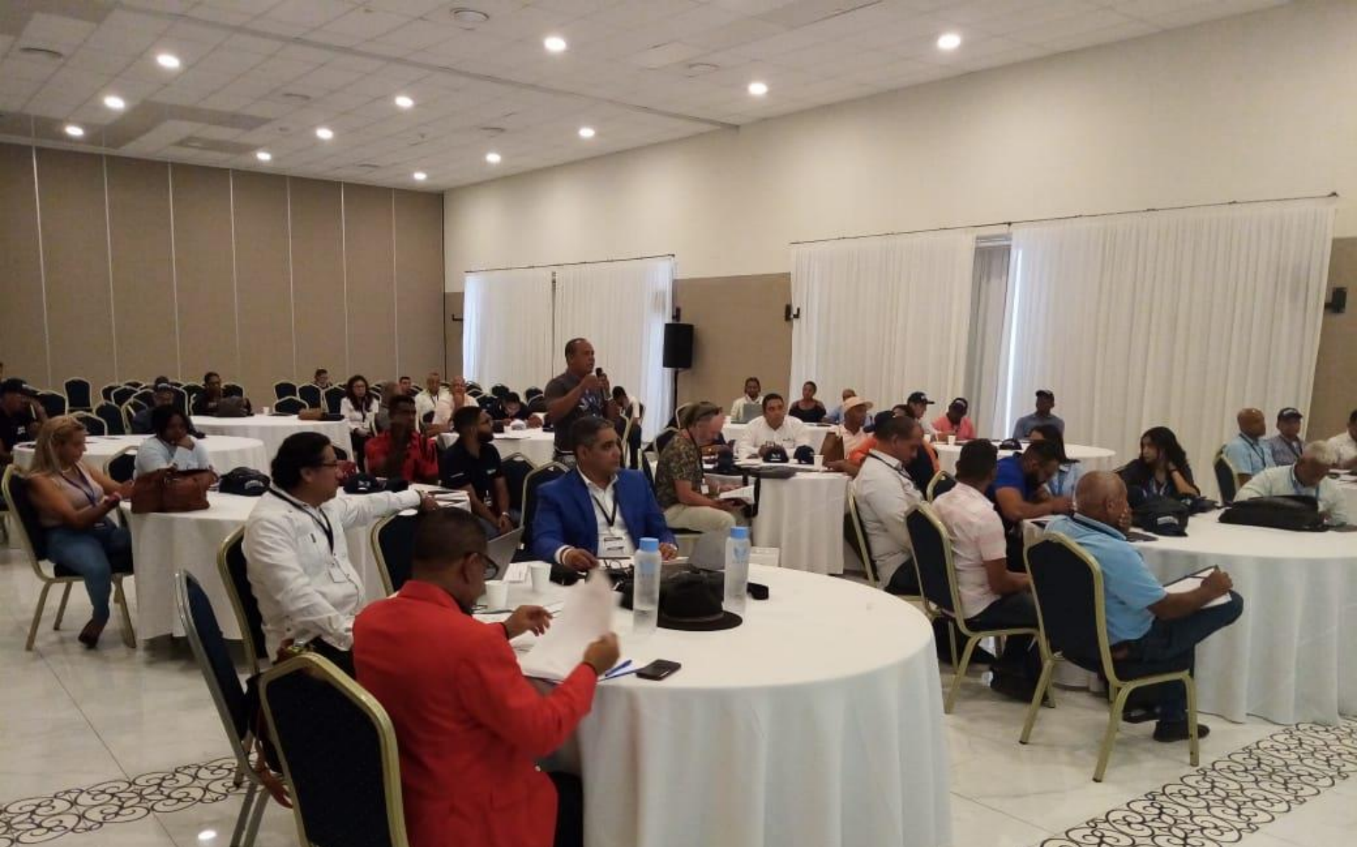
Foro Acuicultura Regional: Presente y Futuro Publico Presente