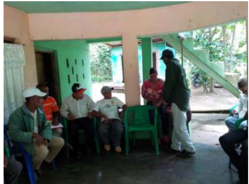
Reabastecimiento de Agua en la Microcuenca Mahomita, Municipio Los Cacaos, Provincia San Cristóbal, República Dominicana